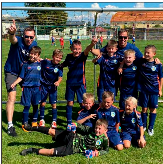
Starší přípravka B ve Stěžerách

Velmi úspěšný podzim má za sebou i starší přípravka B , která na podzim neprohrála ani jeden zápas. Tým A rovněž podává dobré výkony, pracuje na technice a drží se v první polovině tabulky.