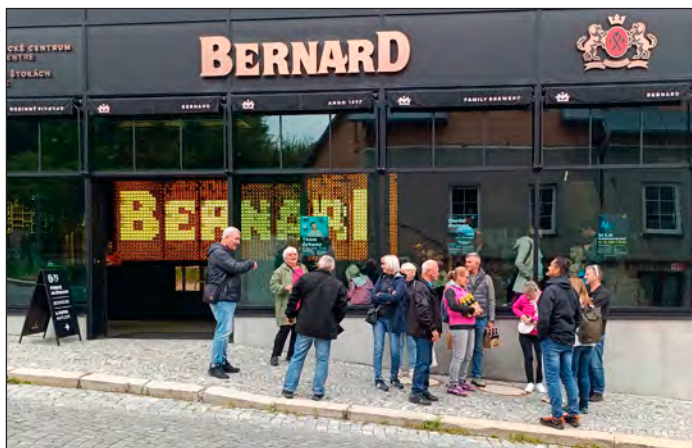
Část výletníků před pivovarem Bernard v Humpolci.