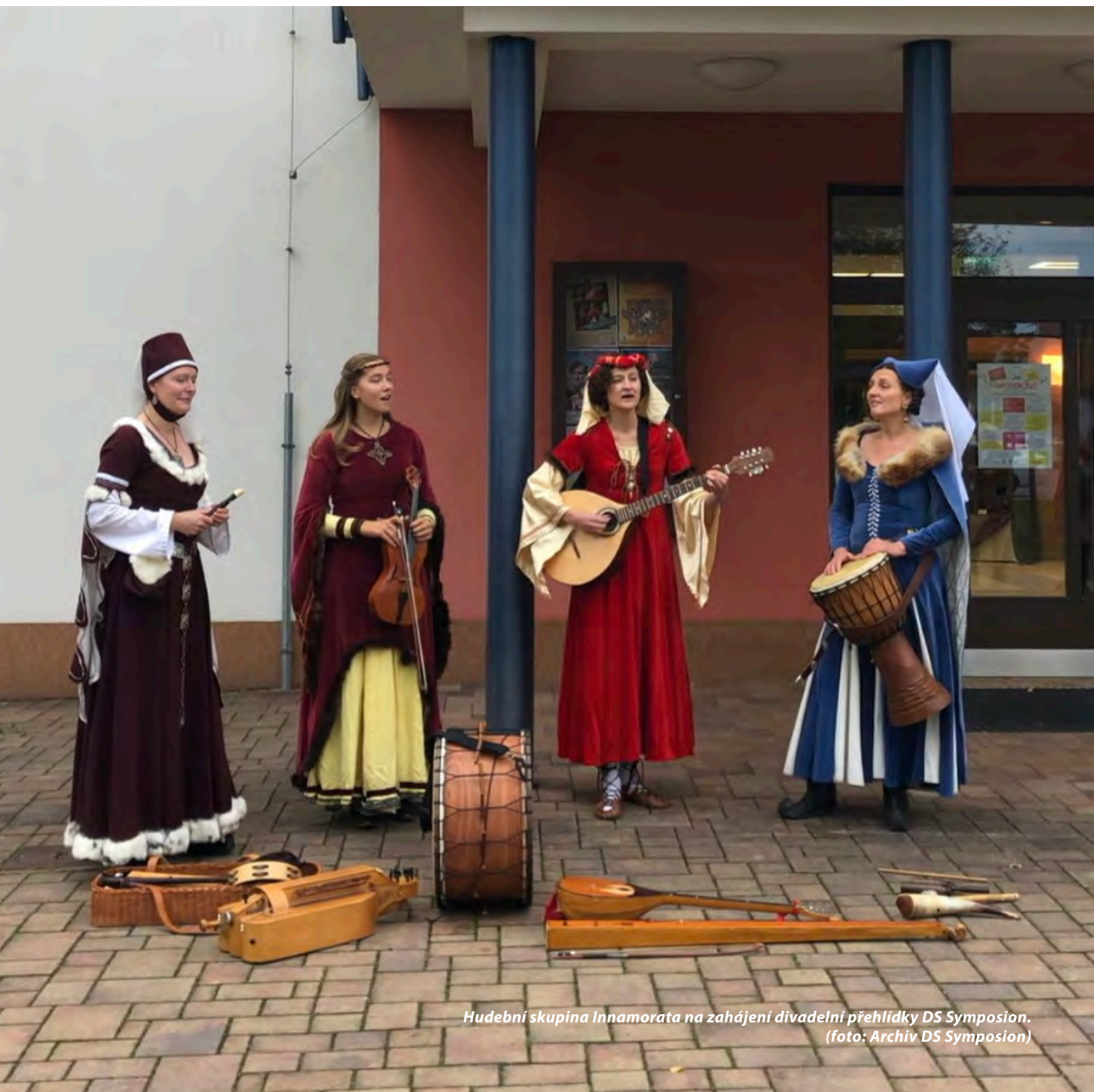
Hudební skupina Innamorata na zahájení divadelní přehlídky DS Symposion.

LESOPARK BOR BĚHEM PODZIMU DO NOVÉHO KABÁTU