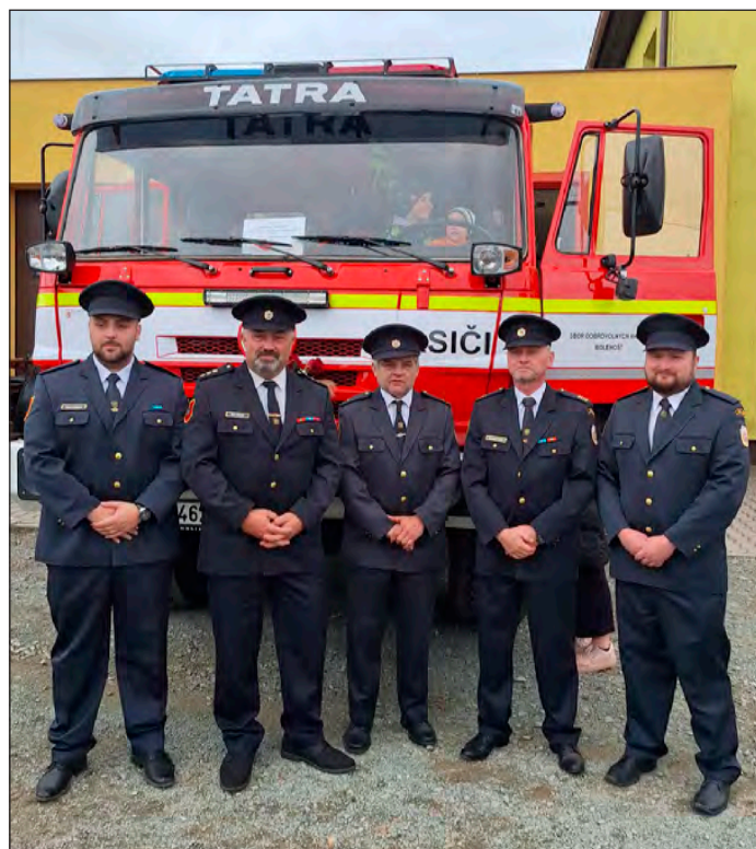
Ledečtí hasiči u nového vozidla Tatra 515 CAS32 v Bolehošti.