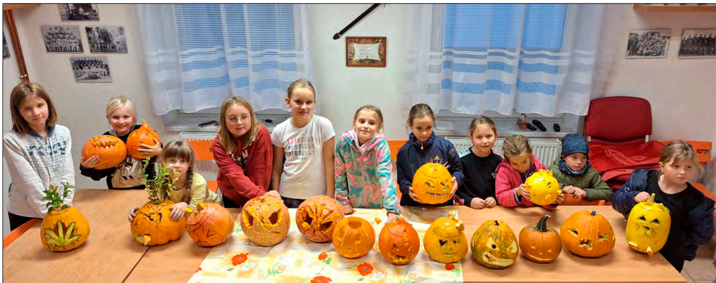
Účastníci tradičního dlabání dýní v hasičské klubovně.

SVĚCENÍ NOVÝCH POŽÁRNÍCH VOZIDEL. Ve dnech 27. září a 11. října se naši zástupci zúčastnili svěcení nových požárních vozidel v Přepychách a v Bolehošti. Oběma sborům z našeho okrsku přejeme co nejméně výjezdů.