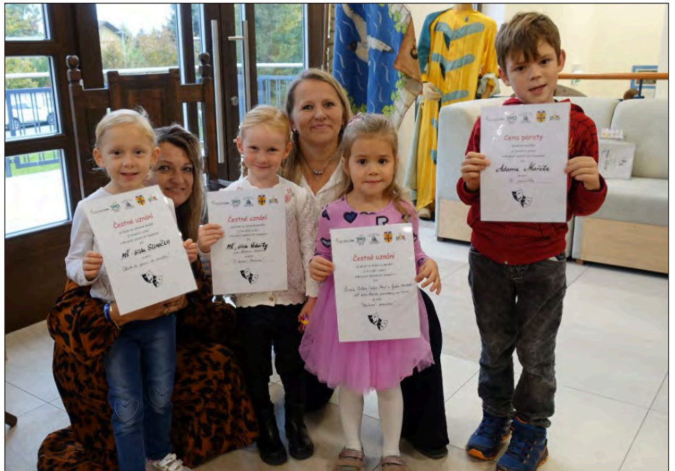
Předání cen výtvarné soutěže