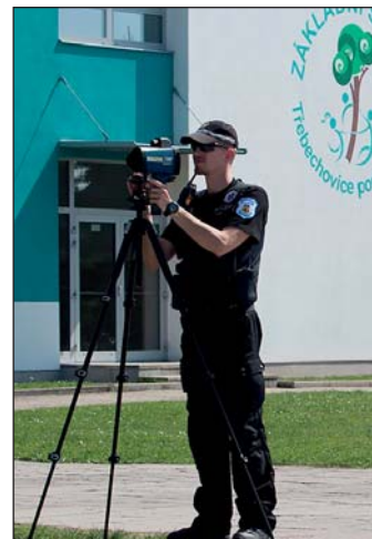
Dne 18. 4. 2018 měření u ZŠ Třebechovice p.O. v rámci SPEED MARATHON.

V ostatních místech, kde neměří rychlost strážníci MP, měří rychlost Policie ČR.