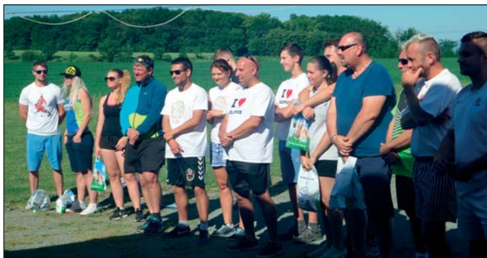
7 krůčků ke zdraví