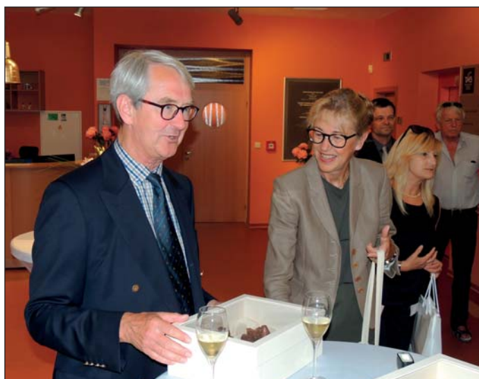
Manžel velvyslankyně obdivoval čokoládový betlém, archiv TMB