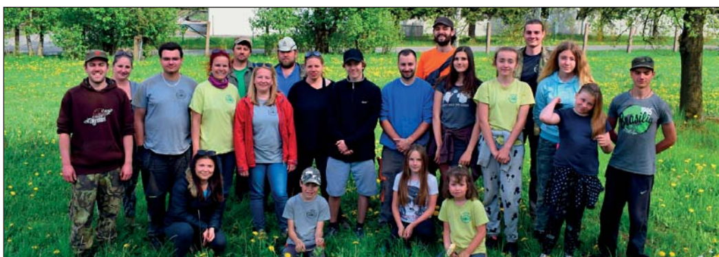
Účastníci brigády v Orlickém Záhoří, foto: Přemysl Pistora

mám říkat, už abychom tábořili. Ale do tábora zbývá ještě několik týdnů. Hned následující sobotu jsme měli, už ani nevím kolikátý (tuším, že sedmnáctý), ročník cyklistického putování mikroregionem Třebechovicko „Okolo Orebu“. Mikroregion Třebechovicko je zároveň partnerem akce, za což děkujeme. Společně s místní organizací Orla jsme na trati přivítali kolem 250 účastníků. Většina z nich vyjela za krásného slunného počasí, aby je těsně před cílem nebo na trati stihla řádná průtrž mračen. Množství vody, které najednou spadlo na zem, bylo tak velké, že bohužel vytopilo i náš skautský dům, a tak bylo nutné ze suterénu vynesit nábytek, vše vytřít a uklidit a po vyschnutí zase vše nanosít zpět. Následující víkend jsme pořádali třetí ročník Skautského orientačního běhu, zkráceně