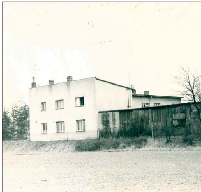
Pohled z 60. let 20. století na čp. 827 z dnešní Proboštovy ulice