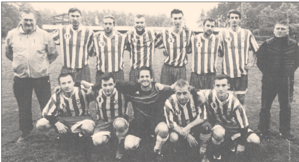
Třebechovice pod Orebem by ještě rády zabojovaly o návrat do I. A třídy