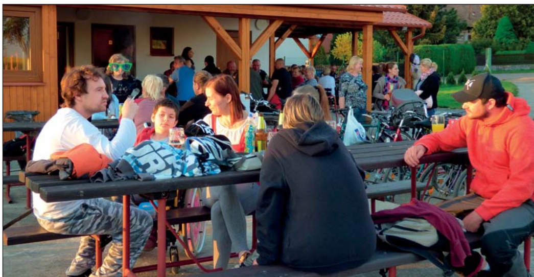
Pálení čarodějnic, foto: Bc. Ivana Novotná

převážně venku. Malé čarodějnice se převlékly do svých kouzelných kostýmů a daly vyniknout svým bradavicím. Opekli jsme si buřtíky a před samotným zapálením ohně jsme kupu ještě zkrášlili o 3 vyrobené čarodějnice, které jsme pak hromadně upálili. Lampióny štěstí jsme letos raději neposílali do světa kvůli velkému suchu.