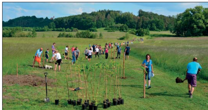
Sázení lipové aleje, foto: Jana Rydlová