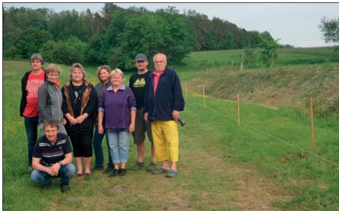
Budoucí lipová alej a zastupitelstvo obce

K 100. výročí vzniku samostatného československého státu uspořádala obec výsadbu lipové aleje. 9. 5. zastupitelé obce vyměřili a zatloukli kolíky pro výsadbu 98 lip. V neděli 20. 5. proběhla krásná akce, sešlo se hodně spoluobčanů. Některá rodina měla i 5 členů a všichni se zapojili při sázení „své“ lípy. (Rodin bylo 61.) Někteří pod lípu zakopali lahev s poselstvím, někteří ji pokropili šumivým vínem, skoro všichni se u své lípy vyfotili, někteří vyzkoušeli její stín a přivezli si na akci i židličky. Nedělní sázení probíhalo od 16 do 20 hodin. Ve středu 23. 5. Dosázely lípy za své nemovitosti ještě 3 rodiny a zbytek dokončili dobrovolníci v dopoledních hodinách v sobotu. Členové mysliveckého spolku Králova Lhota zajistili v pondělí 28. 5. kolem každé lípy pletivový obal proti okusu zvěří. Poděkování patří i p. Machovi a p. Vlachovi. Ti se postarali, aby lípy dostaly vodu, a několikrát v týdnu nám je všechny zalili. Ten, kdo lípu za svoji nemovitost sadil, stává se jejím patronem. Tato akce bude zanesena podrobně do kroniky obce pro naše potomky.