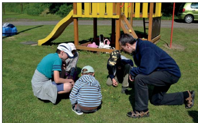
"Kuličkíada" v Jeníkovcích