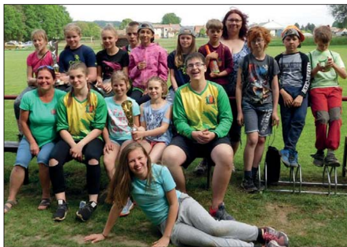
Mladí hasiči s vedoucími, foto: Ing. Jitka Panenková

Blahopřejeme a těšíme se na další úspěchy!