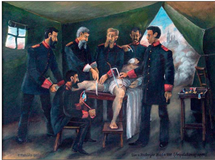
Kresba Pavel Matuška. Tam u Králového Hradce....