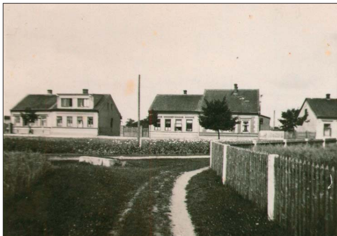
Zprava čp. 160, čp. 466 a 467, 475 a 476 (přibližně 30. léta 20. století)

Jindřich Filip byl v letech 1967-70 předsedou JZD Oreb Třebechovice.