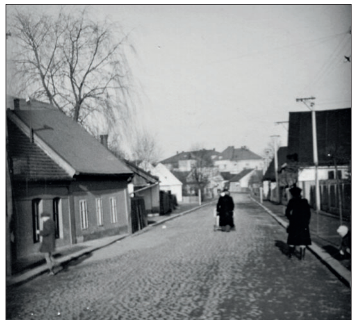
Pohled do Pardubické ulice v roce 1943 (zleva část čp. 362 a 190)