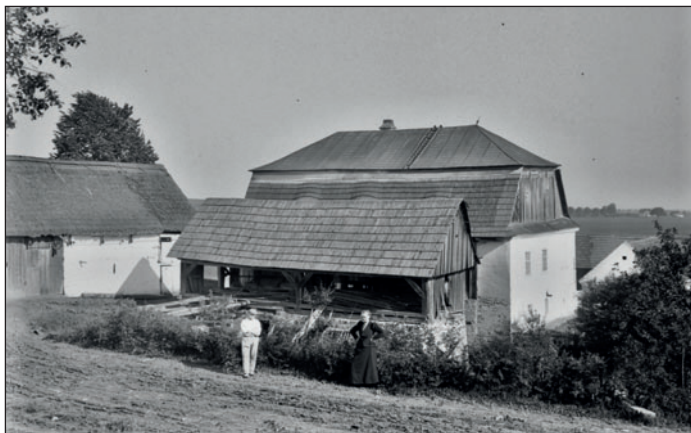
Břeker a pila v Městci nad Dědinou (počátek 20. století)