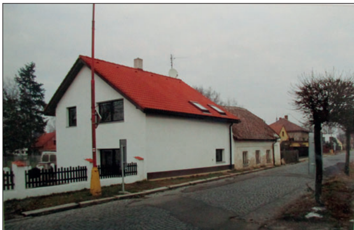
Vlevo čp. 362 po rekonstrukci, za ním čp.190 před rozbořením