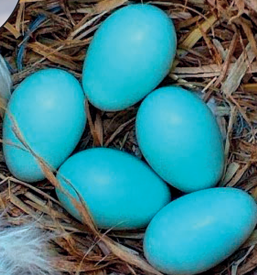
Snůška vajec špačka obecného

DOTACE TŘEBECHOVIC OD KRÁLOVÉHRADECKÉHO KRAJE