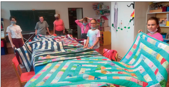
Ilustrační foto archiv DDM