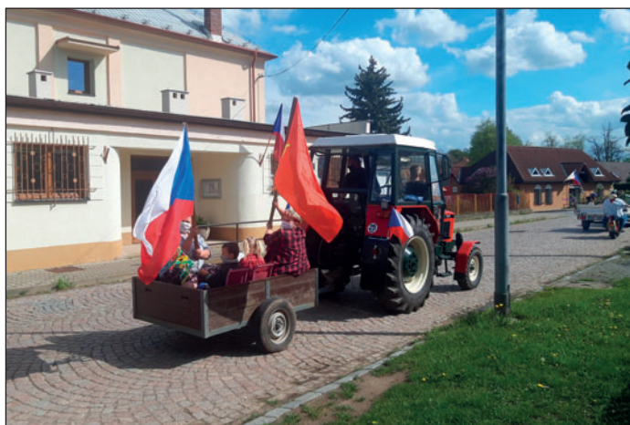
1.máj v Jeníkovících