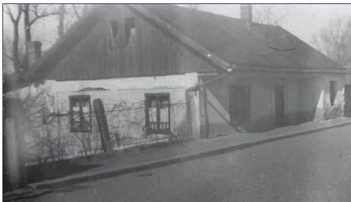
Původní čp. 191, rozbořen v roce 1956