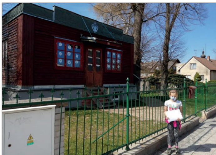
Světlušky s rodiči absolvují procházku městem s úkoly, foto rodiče Světlušek