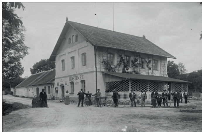
Hostinec u Bašů v Očelicích