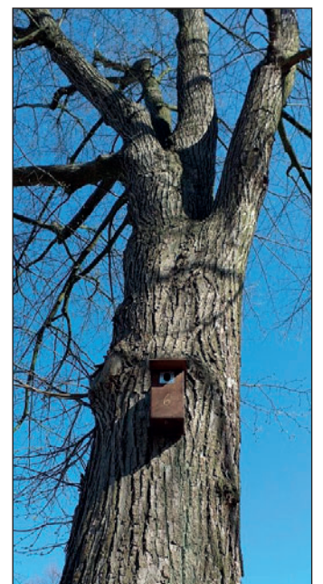
Sýkorník instalovaný na Orebu