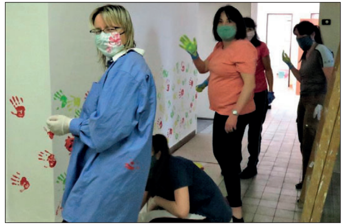
Paní učitelky pro fotografa trošku zapózovaly...

tudíž možné, abyste přihlášku předali osobně v kanceláři školy. My vaši přihlášku zaregistrujeme a v posledním srpnovém týdnu děti pozveme k talentové zkoušce. Do tanečního oboru přijímáme děti od pěti let, do literárně dramatického oboru děti, které nastoupily do první třídy základní školy, a starší a do hudebního oboru děti od šesti let. Informace o organizaci školního roku 2020 – 2021 naleznete v bloku Dokumenty na našem webu (zustre.cz).