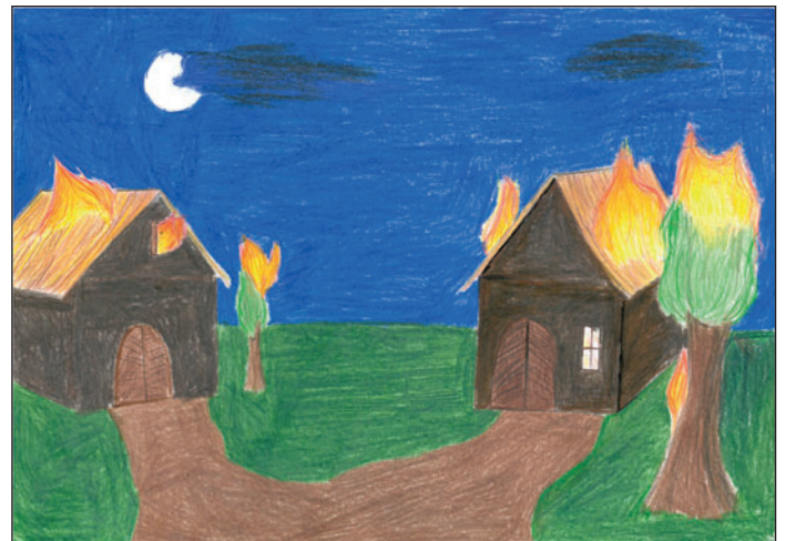
Ilustrace Adéla Karásková, 7.B ZŠ Třebechovice p. O.

A tak se ve stíněné atmosféře konal jarmak. Vždy po zimě byl četně navštěvovaný. Bylo 18. dubna 1600 po třetí hodi-