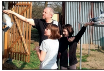
Naši chovatelé