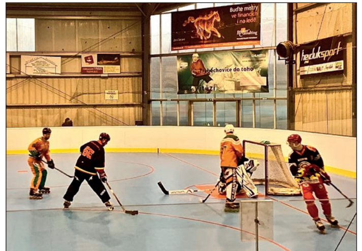
Nová in-line plocha na našem ZS II - autor Ing. Stanislav Jech

Technické služby se těší na vaši návštěvu!