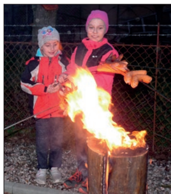
Opékání párků před klubovnou