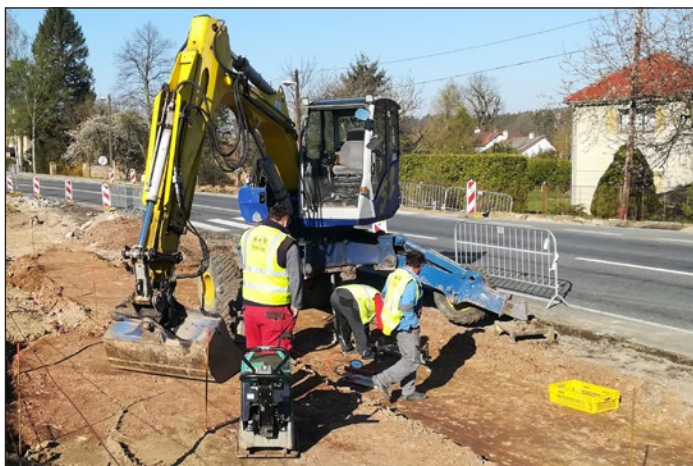
Polánky, foto ze stavby