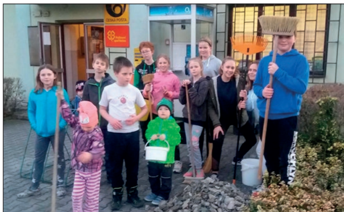
Úklid parčíku, Vlčková

Mladí hasiči, jejich rodiče a členové SDH se 21. 3. zúčastnili brigády - úklid parčíku. Druhá brigáda se konala 30. 3., tentokrát se uklízeli les u Mokřadu. Všem brigádníkům děkujeme, kus dobře vykonané práce je vidět na první pohled.