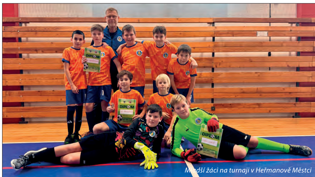
Mladší žáci na turnaji v Heřmanově Městci