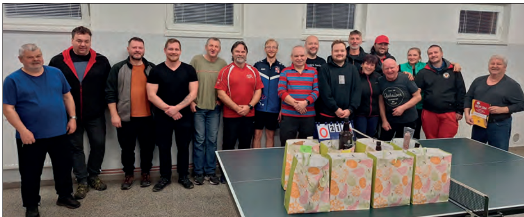
Účastníci tradičního zimního turnaje ve stolním tenisu.

Zatímco v sobotu 10. ledna venku panovalo mrazivé zimní počasí, v hasičské klubovně bylo pořádně horko. Místní parta nadšenců, která se v zimním období pravidelně schází každé pondělí a čtvr-