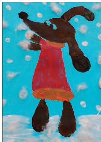
Archiv DDM dětské práce kroužku výtvarka jinak