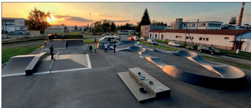
Skatepark a pump track