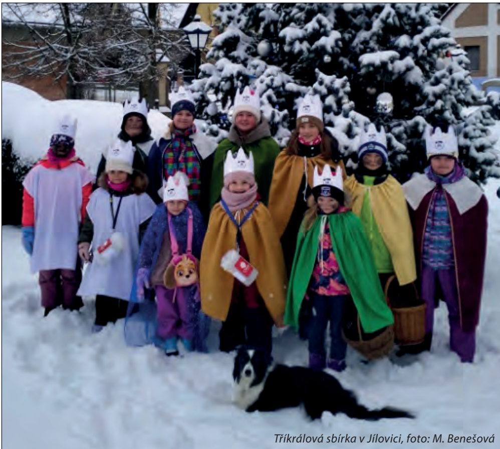
Tříkrálová sbírka v Jílovici, foto: M. Benešová