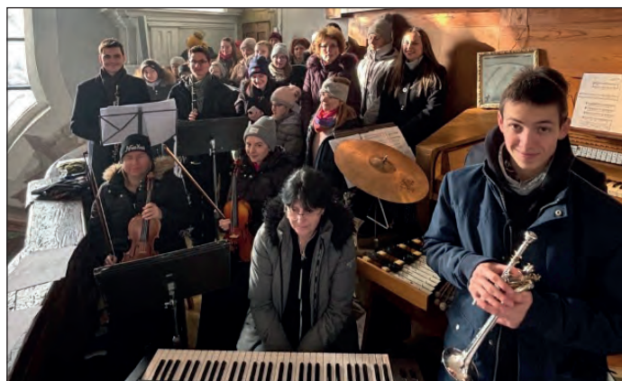
A stejně plná byla i druhá polovina kůru