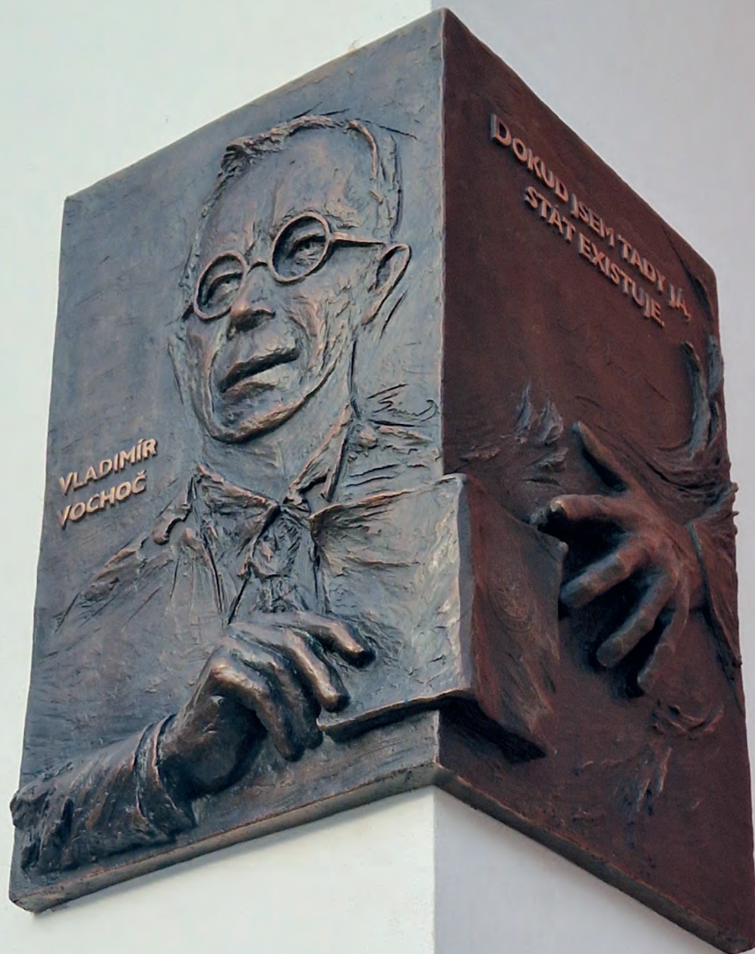
Nová pamětní deska Vladimíra Vochoče na budově městského úřadu