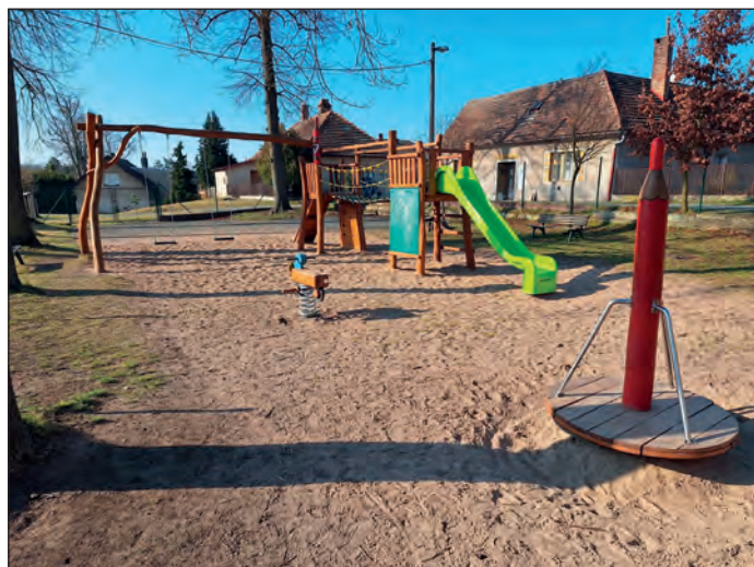
Dětské hřiště u knihovny