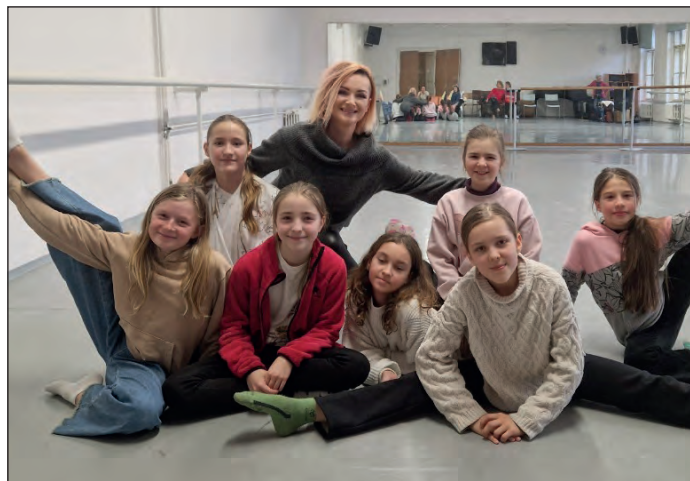
Žákyně tanečního oboru v baletním sálu konzervatoře

Na konzervatoři jsem nejdříve provedla žákyně po hlavní budově a poté jsme přešly do budovy na Rejdišti, kde tančí starší žáci. Nejdříve jsme zhlédly taneční partneřinu 8. ročníku pod vedením profesora Michala Štípy a profesorky Nikoly Márové, dále scénickou praxi 8. ročníku pod vedením profesorky Nikoly Márové, moderní tanec 5. ročníku pod vedením profesorek Šimůnkové a Drápalíkové, lidový tanec 5. ročníku pod vedením profesorky Kaprasové a na závěr charakterní tance pod vede-