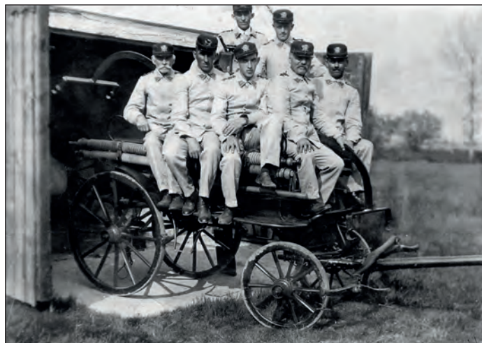
Historická fotografie z 30. let 20. století

V minulém čísle šlo o historický snímek na historické stříkačce. My máme v archivu ještě starší. Tady je: