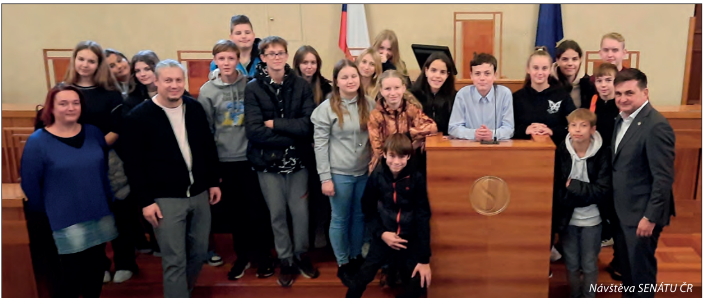
Návštěva SENÁTU ČR