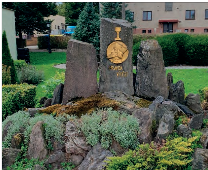
Husův pomník, FOTO: Ježková

„Naše obec má 104 domů, většinou zděných, s tvrdou krytinou. Pouze č. p. 1 má ještě střechu doškovou, ale pro nezpůsobilost k obývání není obydleno a bude zbouráno. Počet obyvatel dosahuje 306, převážně pracuje v zemědělství, všichni národnosti české. Dle náboženského vyznání hlásí se dvě třetiny obyvatel k víře katolické a jedna třetina k evangelické. Uprostřed obce stojí dům obce a Kampeličky, postavený roku 1933, v němž je umístěn poštovní úřad a obecní knihovna. Mezi lipami postavili katoličtí občané roku 1883 kříž a vedle něho dřevěnou zvonici. Evangeličtí občané zase svým nákladem roku 1934 Husův pomník.“