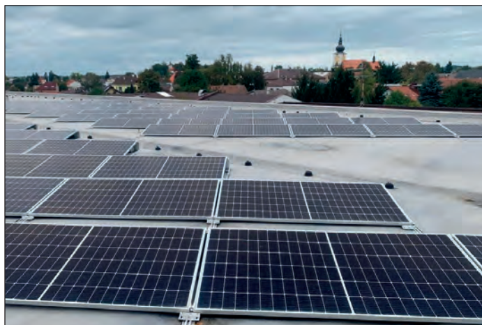
Fotovoltaika na střeších pavilónů ZŠ

Na zimním stadiónu byla v půlce září dokončena instalace nového chlazení (viz foto), které nahradilo 50 let starou technologii. I zde se