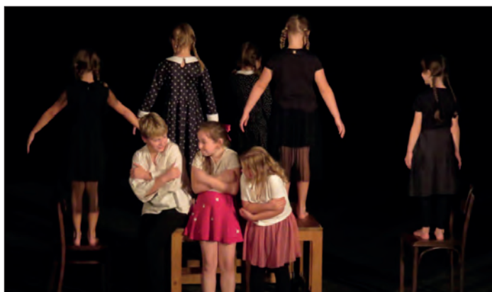
Z představení O perníkové chaloupce