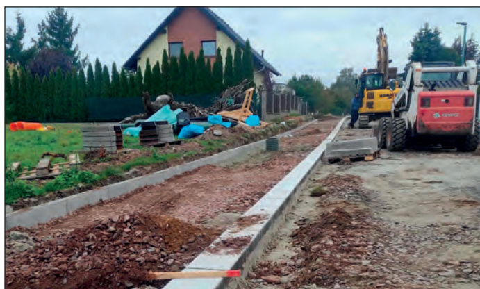
Rekonstrukce ulice Družstevní práce, FOTO: Archiv MěÚ