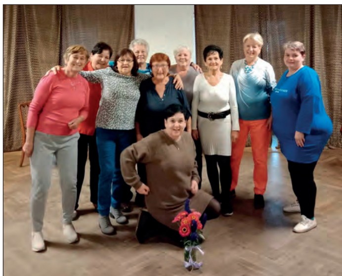
„Čaj o třetí“