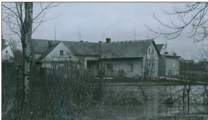
Čp. 309 v pohledu od řeky Dědiny při velké vodě v roce 1968