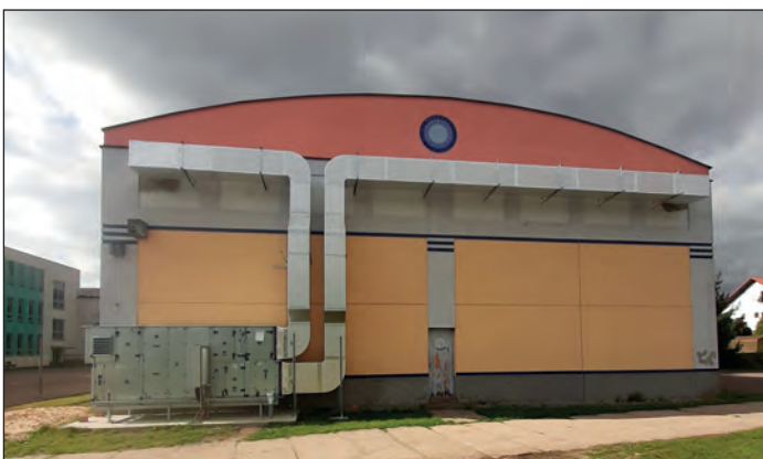
Rekuperační jednotka tělocvičny ZŠ, FOTO: Archiv MěÚ