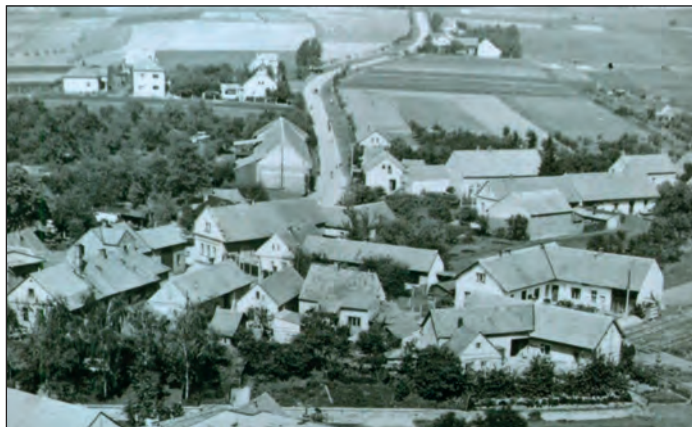
Pohled na Staroměstské náměstí z věže kostela, konec 50. let 20. století

V kronice města je k tomuto číslu také záznam o požáru: „Oheň 29. dubna 1881 opět na starém městě ve stodole při čísle 307, strávil stodolu, hasiči uhájili kolem stojící dřevěné domky, škůdce zůstal neznám.“ V dřívějších dobách tu ale bylo požárů mnohem víc.