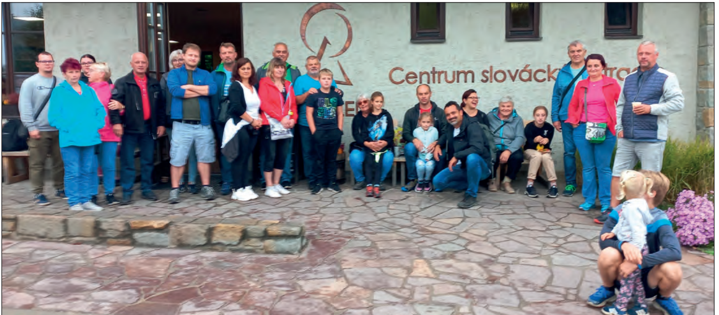
Někteří z účastníků obecního výletu před Centrem Slováckých tradic, kde se všem líbilo