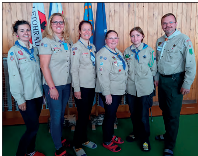
Vedoucí na Poradní skále, FOTO: Jitka Krejcarová

stromů. Smečka vlčat se zapojila do programu Patronáty, kde se skupinám dětí a mládeže ukazuje, jak se aktivně zapojit do ochrany přírody. Vlčata se tak pod dohledem pana Svobody z CHKO zúčastnila čištění ptačích budek, kdy si i sama vyzkoušela, jak budku správně rozdělat a vyčistit. Aktivita to byla nejen zajímavá, ale i užitečná. V půlce října se pak celá smečka vydala do Bědovic na tradiční výpravu a poradní skálu, kde proběhlo přijímání nováčků do oddílů. Skauti hojně využívali takřka letních teplot a hráli nejrůznější venkovní hry, jako je ringo nebo špaček, což je česká variace na softball. Skautky si svůj program připravují samy a zaměřují se na různé hry a aktivity. V polovině října se také účastnily Závodu skautských hlídek v Dolní