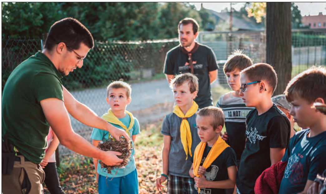
Vlčata čistí ptačí budky

S přispěním oddílových vedoucích zapsala Lucie Štursová