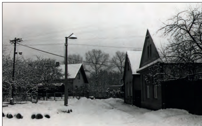
Pohled na východní a část jižní strany Staroměstského náměstí v lednu 1979 (vzadu čp. 308, vpravo čp. 311 a 312)