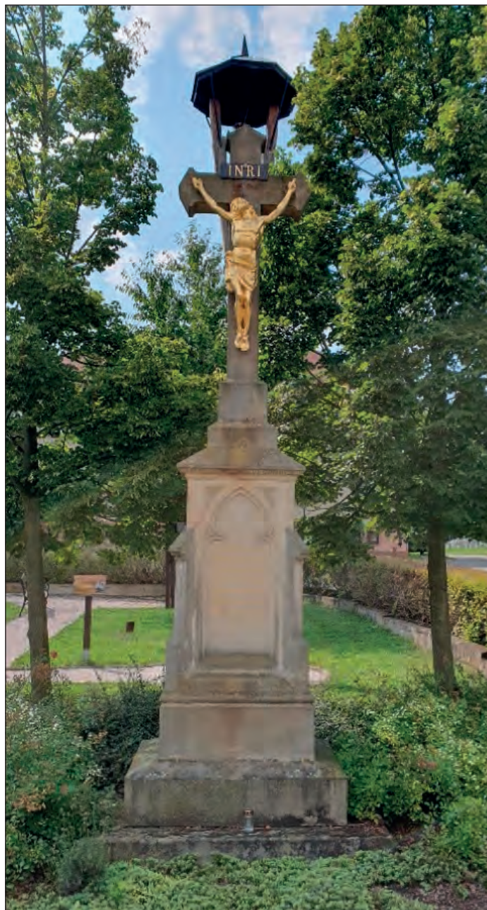
Kříž