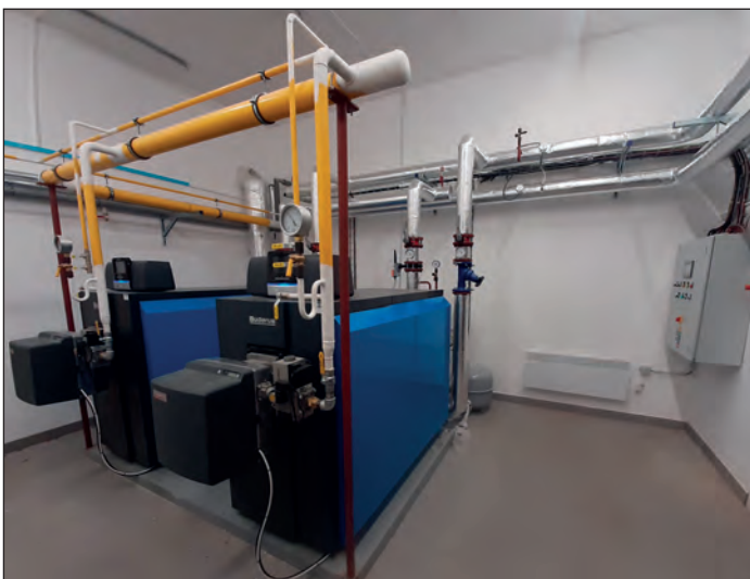
Nová kotelna ZŠ