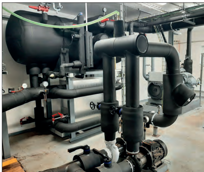
Nové chlazení na zimním stadiónu