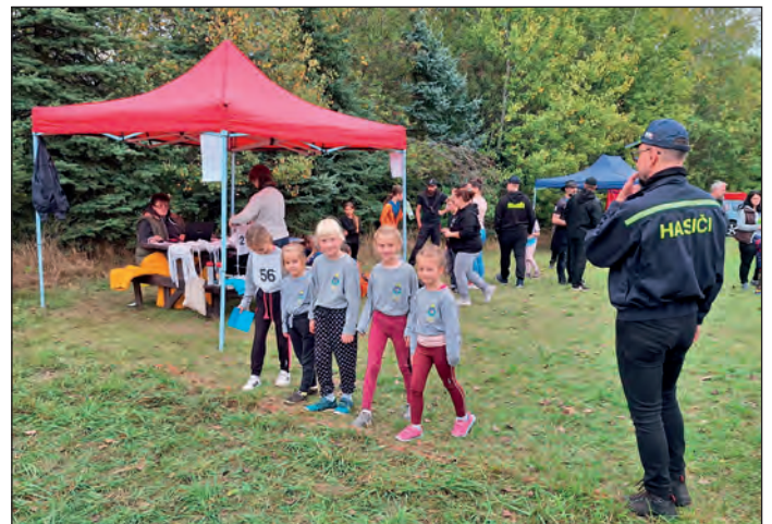
Družstvo mladších hasičů na startu branného závodu, FOTO: Jitka Dědková

V neděli 1. října jsme v hasičárně uspořádali celodenní soustředění, kde se střídalo ze vzduchovky, přelézalo lano, běhalo, opékaly párky. Hlavně se však probírala nová teorie, která letos vešla v platnost. Poslední trénink jsme měli v pátek 13. října, kdy jsme dopilová-