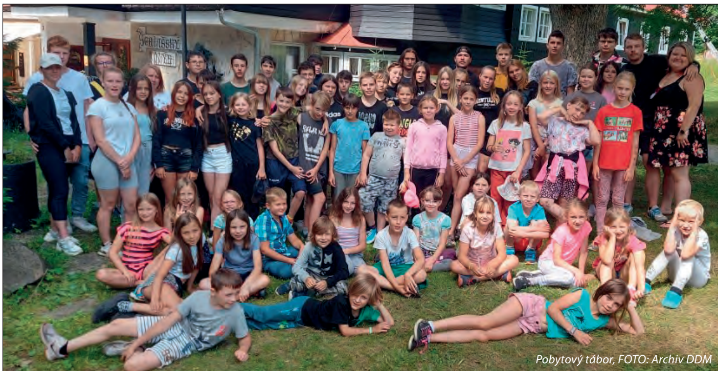
Pobytový tábor