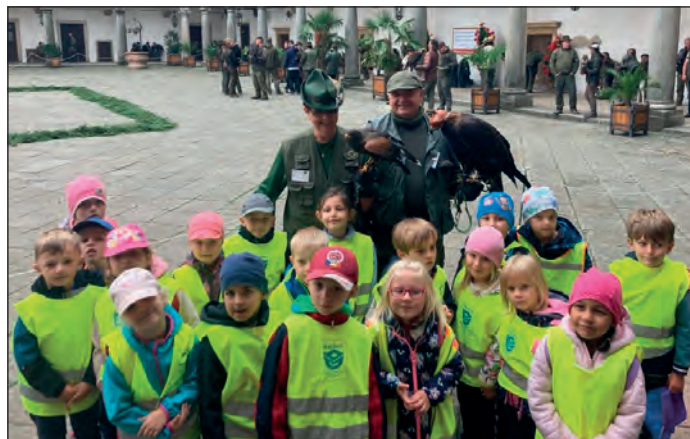
Děti z MŠ na 56. setkání sokolníků v Opočně

sokolníci se svými dravci městem Opočnem a sokolnickou organizací přivítání a rozdělení do skupin k lovu. 9. 10. v naší MŠ proběhlo „Vláčkohraní“, kde si děti měly možnost vyzkoušet programování a pouštění elektrických vláček. Bylo to pro ně nové, velmi naučné a zábavné. 11. 10. jsme se s dětmi a rodiči vydali za vesnici pouštět draky. Účast rodičů byla hojná. Vyrazilo s námi 20 rodinných příslušníků. Tímto jim chceme poděkovat za příjemně strávené dopoledne. Děti si pouštění dráčků užily. Na drakiádu s námi vyrazili i naši kozlíci Karlík a Jeník. Počasí se vydařilo. I ten větřík se nám nakonec rozfoukal. Koncem měsíce října mohou rodiče s dětmi nosit výrobky z dýní či jiných přírodnin, které ozdobí budovu a zahradu MŠ. K této výzdobě použijeme vyrobené podzimní dekorace z tvořivého odpoledne s rodiči. Děti získají cenu za neoriginálnější výrobek a za účast. A na závěr měsíce se budeme všichni těšit na podzimní prázdniny, které nás čekají 26.–27. 10. 2023.