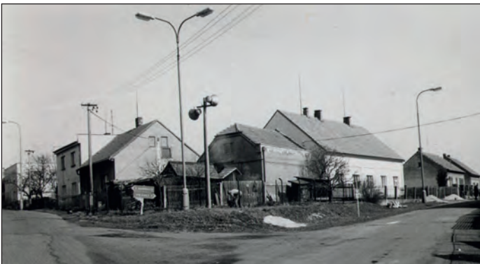
Pohled na křižovatku ulic v dubnu 1984. Zleva čp. 320, 297, 293, 319, 530 a 838