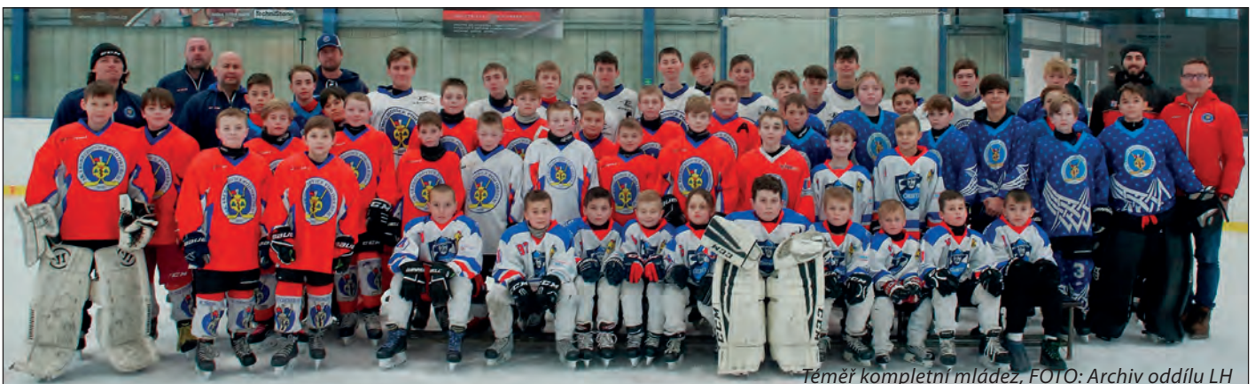
Téměř kompletní mládež