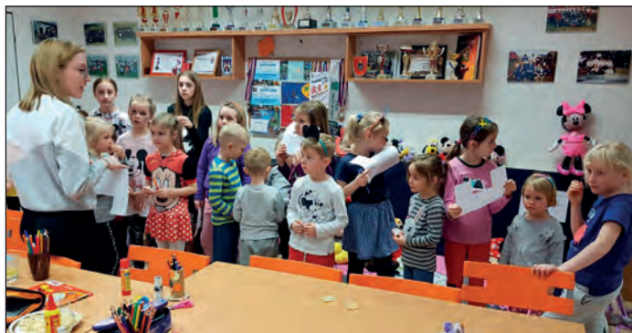
Příprava na jednu z her, která v průběhu večera proběhla.