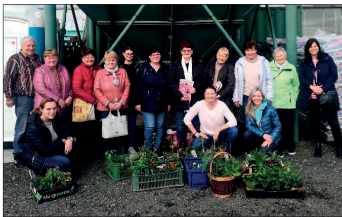
Jílovické zahrádkářky ve Světí

Ve středu 5. 4. 2023 se uskutečnila výroční členská schůze spolku Zahrádkářů Jílovice. Sešli jsme se v hojném počtu a přivítali do našich řad dva nové členy. Řekli jsme si pár slov k činnosti za rok 2022 a co nás čeká v roce 2023. Odměnou nám pak byl výborný guláš