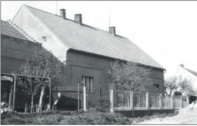
Čp. 319, vpravo čp. 530