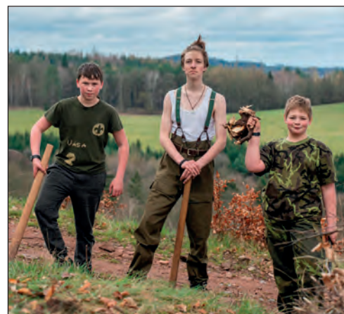
Skauti likvidují náletové stromky

Celovíkendovou akci si naplánovali skauti. Osm z nich a tři vedoucí se vydali vlakem do Náchoda, kde měli zajištěn nocleh v pěchotním srubu Lom. Program víkendu byl akční: prořezávání náletových stromků a pálení větví nedaleko bunkru Březinka,