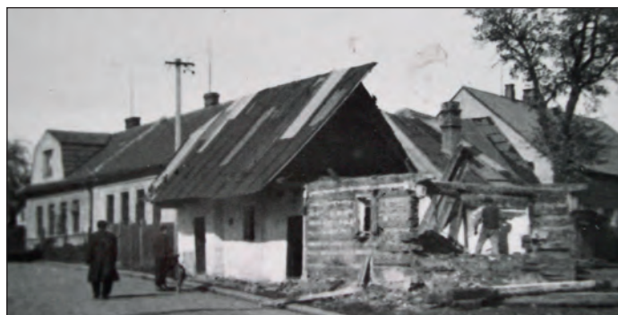
Čp. 303 při bourání v dubnu 1953, za ním stojí čp. 293 a 297