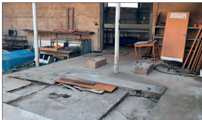
Zmizela i tzv. mikrověž ochlazující plynný čpavek