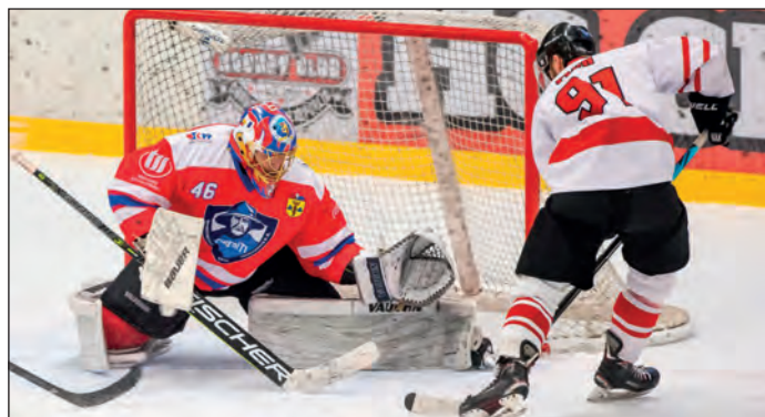
Osmifinále mužů s Chrudimí, FOTO: Archiv oddílu LH

V sezóně 2022–2023 se nejvyšší krajská soutěž mužů opět hrála systémem, kdy se v první části potkaly týmy v rámci svého kraje a ve druhé části pokračovala nadstavba ve dvou výkonnostních skupinách společně s týmy z Pardubického kraje. Do osmifinále play-off pak vstoupilo všech 16 účastníků, hrálo se na tři vítězné zápasy. V úvodní části jsme střídali povedené zápasy s těmi méně povedenými, hlavně se nám nedařilo na hřištích soupeřů, a tak jsme skončili na 6. místě Královéhradecké skupiny s výrazným desetibodovým odstupem za první čtyřkou. V nadstavbové skupině jsme až do závěrečného zápasu hráli o prvenství ve skupině. Nakonec jsme obsadili 3. místo a v osmifinále nás čekal 6. tým z naprosto vyrovnané A skupiny společné soutěže, tým HC Chrudim. Osmifinálovou sérii jsme zahájili překvapivou výhrou na ledě soupeře, Chrudim na oplátku vyhrála na našem