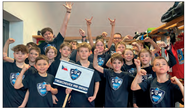
Na turnaji v Itálii, FOTO: Archiv oddílu LH

Pro hráče ročníků 2010/2011 a 2008/2009 jsme na konec sezóny naplánovali účast na třídním mezinárodním turnaji v italském městě Fondo nedaleko známého Bolzana, v 1000 metrech nad mořem. Obě kategorie změřily síly s výběry Polska, Německa, Slovenska,