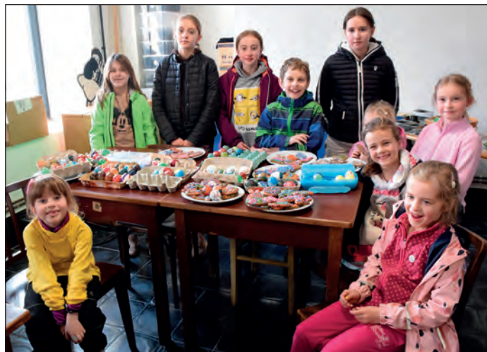
Velikonoce v pivovaru.