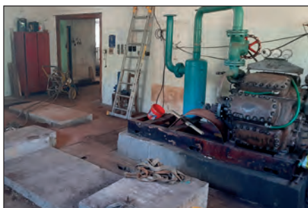
Demontáž chlazení ve strojně provedena, FOTO: Archiv správy majetku