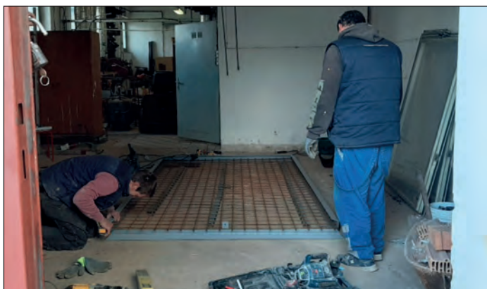
Budování základu pro dva nové kondenzační kotle