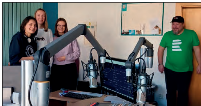
Studenti LDO na semináři zvukové tvorby v Českém rozhlasu v Hradci Králové