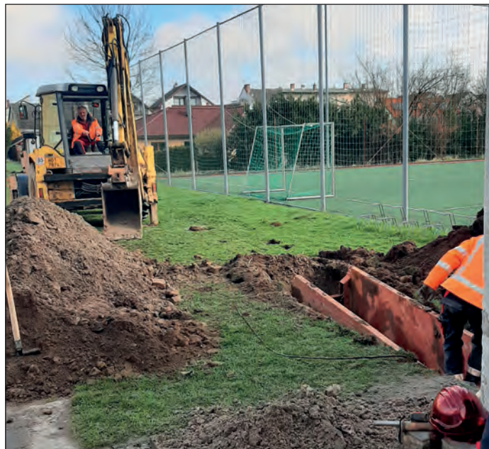
Provádění výkopů pro vzduchotechniku do tělocvičny, FOTO: Archiv správy majetku

Probíhají stavební práce v souvislosti s přípravou kotelny (demontáž zařízení, demolice základů a dlažby, zadržování oken), kde budou nově osazeny 2 ks kondenzačních kotlů. Kotle budou umístěné na nový betonový základ. Dále započaly