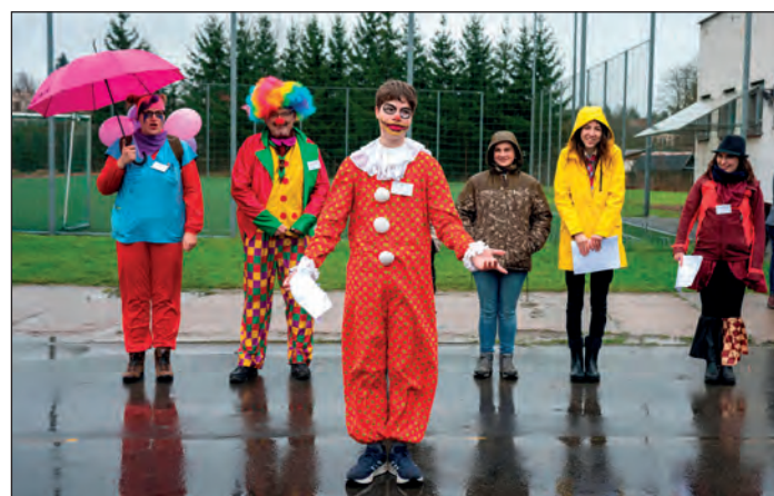
Klauni na Svojsíkově závodě

Akcemi nabitě jaro v našem skautském středisku pokračuje i v měsíci dubnu. Účastnicky rozhodně nejpočetnější akcí se stal Svojsíkův závod, který letos pořádalo naše středisko a konal se 1. dubna, tedy na apríla. Tomu odpovídalo počasí, které s námi celý den laškovalo, a zažili jsme vše od slunce přes průtrž mračen až po nádhernou duhu. A aprílem se také inspiroval přípravný tým závodu, který zvolil příznačné téma Klauni. Závodu se účastnilo téměř 90 dětí ze středisek Třebechovice, Chlumec nad Cidlinou a Stěžery. Rozdělením do 15 hlídek se účastníci museli popasovat jak se stanovišti zaměřenými na družinovou spolupráci