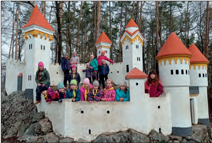
Světlušky na Kočičím hrádku

návštěva okolních menších bunkrů i známého Dobrošova, vaření bramboračky a opékání buřtů, promítání dokumentu z dobývání bunkru Březinka nebo noční hra formou stopované po svíčkách. Domů se kluci vrátili sice unavení, ale nadmíru spokojeni. Zatímco skauti si užívali chlapeckého prostředí bunkrů, oddíl světlušek se v sobotu vydal na výpravu do Slatiňan. Ranním vlakem se dostaly na místo a jejich cesta vedla nejprve ke Kočičímu hrádku, který důkladně prozkoumaly. Následně jejich kroky vedly k rozhledně Bára, na kterou i většina z nich vystoupala, aby se rozhlédla po kraji. Po pauze na oběd a karetních hrách se světlušky vydaly do muzea Švýcárna, kde se dozvěděly více o chovu starokladrubských koní. Po prohlídce vyšly přes zámecký park k hřebčinu, kde se rozloučily s překrásnými koňmi, a pak už jen na nádraží a zpátky domů.