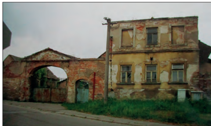
Vzhled čp. 298 na začátku tisíciletí

Dnes v těchto místech stojí nově postavený dům čp. 1420.