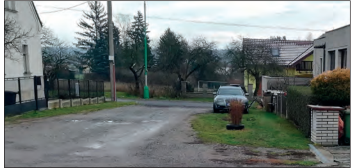
Jedna z ulic před rekonstrukcí

Je tady nový rok a hned na jeho začátku rozjždíme jednu z velkých investičních akcí. V lednu byla na základě výběrového řízení uzavřena smlouva o dílo s vítězným dodavatelem na plánovanou akci s názvem „Základní škola – energeticky úsporná opatření“, která zahrnuje generální rekonstrukci kotelny, vybudování fotovoltaických elektráren na střechách dvou pavilónů a zároveň instalaci rekuperace ve školní jídelně a tělocvičně. V těchto dnech byly dodavatelem zahájeny projekční práce spočívající ve zpracování dokumentace pro provedení stavby. Samotná fyzická realizace akce se předpokládá po skončení topné sezóny. Již nyní se ale objevují v areálu školy zástupci jednotlivých řemesel a obhlížejí „místo činu“. Že zrealizování této akce bude mít v současné době tolik žá-