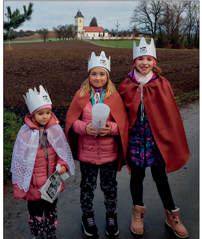
Tříkrálová sbírka.