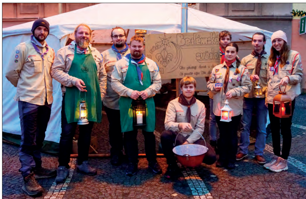
Rozdávání betlémského světla na náměstí