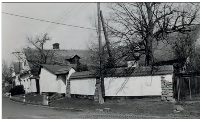
Čp. 436 v roce 1984