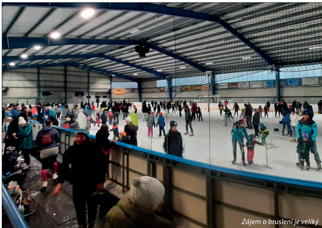
Zájem o bruslení je veliký

V neposlední řadě děláme maximum pro získání dotace na druhou etapu výstavby mateřské školy (druhý zrcadlově stejný pavilón pro čtyři třídy, spojovací „krček“ mezi oběma budovami a parkoviště od ulice Svatopluka Čecha). Během několika týdnů se očekává vyhlášení výzvy o dotaci. My budeme stoprocentně připraveni na podání žádosti s patřičnou dokumentací. Držte nám palce! Bez tučné dotace mateřskou školu těžko dostavíme.