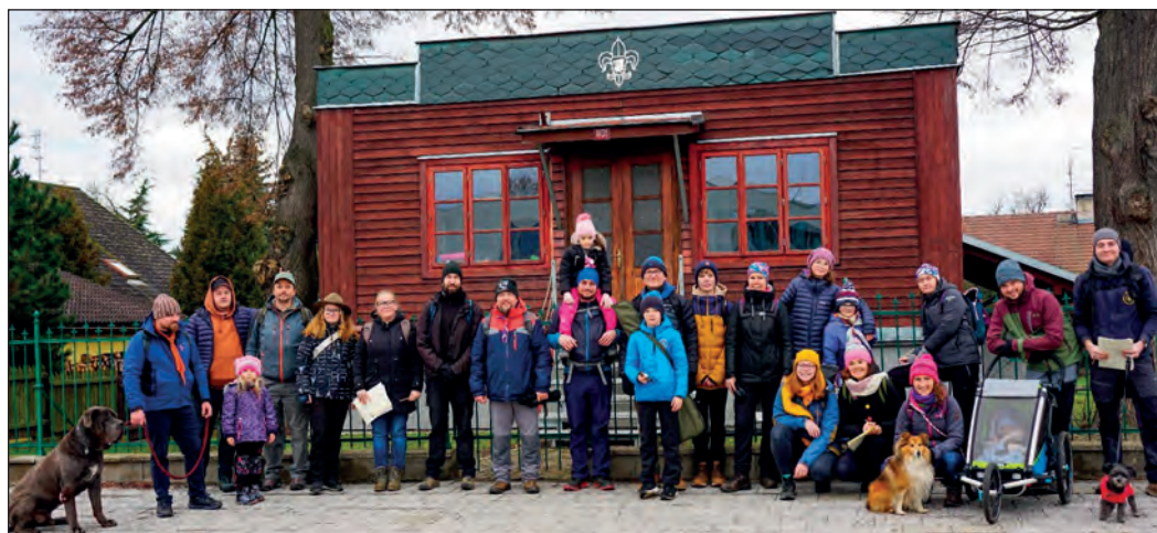
Dospělí před sváteční procházkou

Ten samý víkend, konkrétně v sobotu 7. 1., se ještě značné množství dětí i dospělých z řad skautu zúčastnilo charitativní Tříkrálové sbírky. Na třicet světlušek, vlčat, skautů, skautek i vedoucích si obléklo kostýmy tři krále a vydalo se s kasičkami do ulic a uliček Třebechovic. Výtežek předčil veškerá očekávání, všem mockrát děkujeme za příspěvek na dobrou věc.