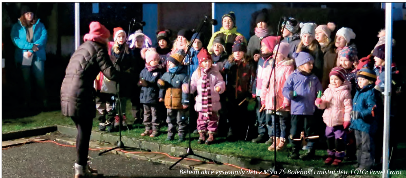
Během akce vystoupily děti z MŠ a ZŠ Bolehošť i místní děti.