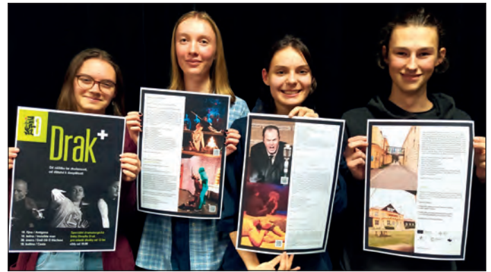
Nejstarší studenti LDO se letos účastní pilotního ročníku série divadelních představení pro náctileté Drak+

vým štábem v reálném čase přímo na jevišti. Filmové triky v přímém přenosu, obdivuhodná spolupráce všech herců a kameramanů, zaměření se na detail, dech beroucí záběry, vtipné situace při natáčení i v přenášeném filmu... Zkrátka obrovská dávka inspirace, jak lze využít filmovou techniku v divadelním prostředí. Nejen my, ale celé vyprodané hlediště Labyrintu Divadla DRAK poděkovalo všem účastníkům projektu dlouhým bouřlivým potleskem. Klobouk dolů a ještě jednou díky!“