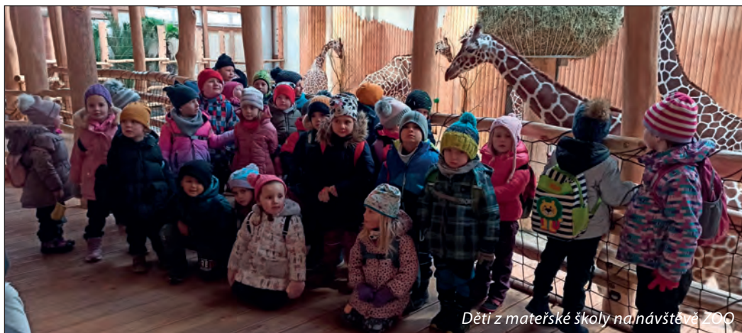
Děti z mateřské školy na návštěvě ZOO