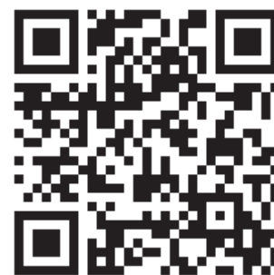
QR kód sbírky ZACHRAŇME SOKOLOVNU