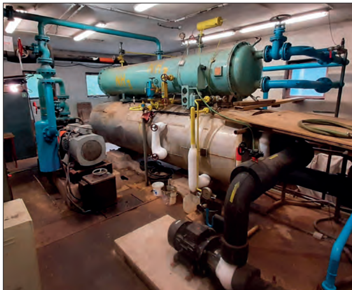
Zimní stadión – chlazení

doucí ekonomický efekt, je nad slunce jasné.