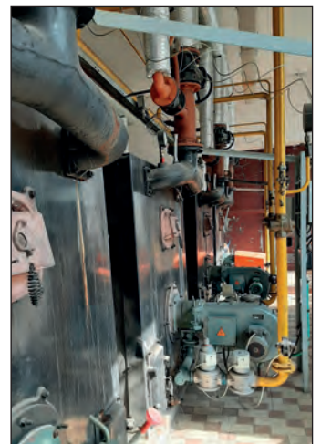
40 let stará kotelna ZŠ

V tomto roce se dáme i do rekonstrukce některých ulic. Počátkem roku byly zahájeny projekční práce na opravu ulice Jiráskova, a to v úseku od ulice Hradecké (podél Motoazylu) včetně křižovatky