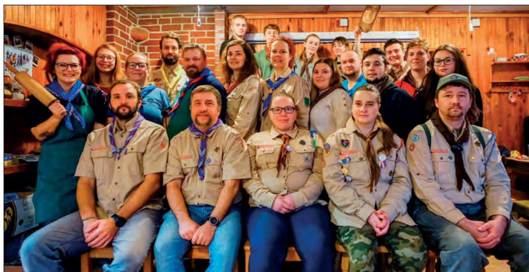
Vedení oddílů na školení

Oddíly po vánoční pauze pokračují ve své činnosti. Smečka vlčat si při jedné schůzce vyzkoušela interaktivní hru Třebechovická stopa, při které se