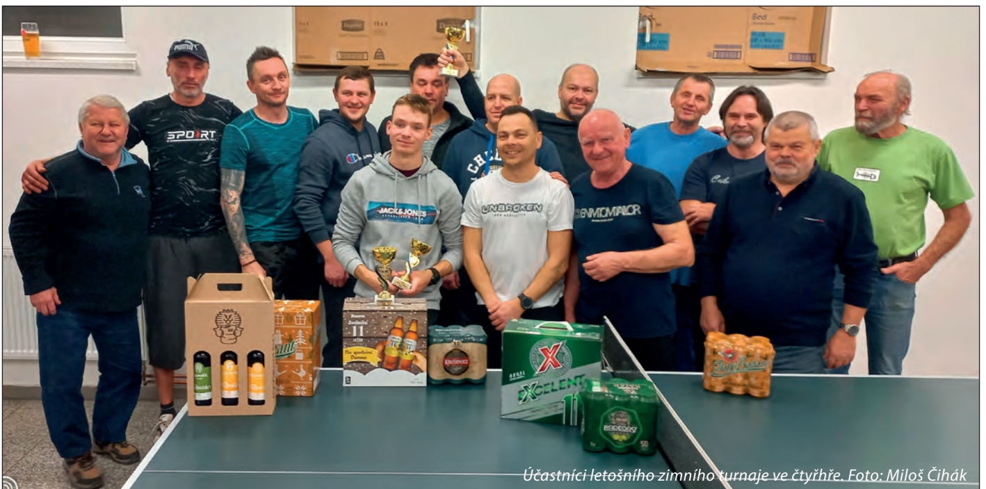
Účastníci letošního zimního turnaje ve čtyřhře.