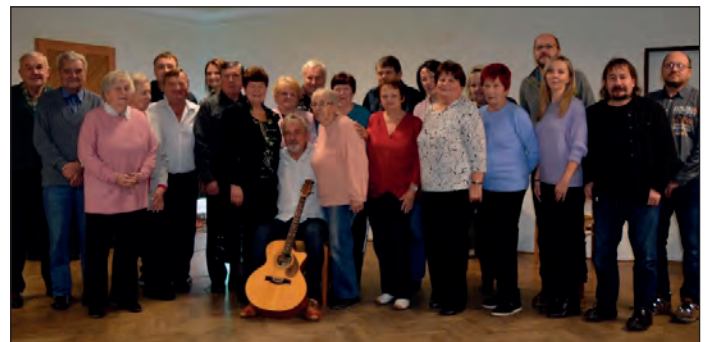
Vánoční setkání seniorů