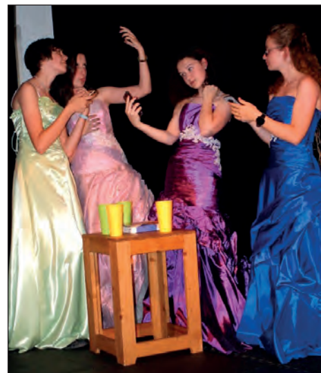
Z derniéry představení Šíleně závislé princezny