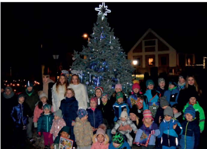
Rozsvícení stroměčku

V sobotu 26. listopadu jsme v parku u pošty rozsvítily vánoční stromček. O příjemnou předvánoční atmosféru se postarala dechová kapela Valanka, kterou přivítal pan starosta V. Ježek. Jménem celého zastupitelstva obce popřál všem lidem pěkný a klidný předvánoční čas, krásné Vánoce a hlavně zdraví a pohodu v příštím roce 2023. Na odpolední akci nechyběl tradiční svařák, punč a koláče. Vůně gulášové polévky přilákala jílovické občany, až když se setmělo. Andělci u stroměčku rozdali dárky jak dospělým, tak i dětem. Letos byli místní občané obdarováni Jílovickým kalendářem a děti knížkou. Ty děti, které se zúčastnily tvoření v knihovně, si odnášely domů i vánoční dekoraci nebo obrázek. Příjemný večer byl zakončen tradičním ohňostrojem.