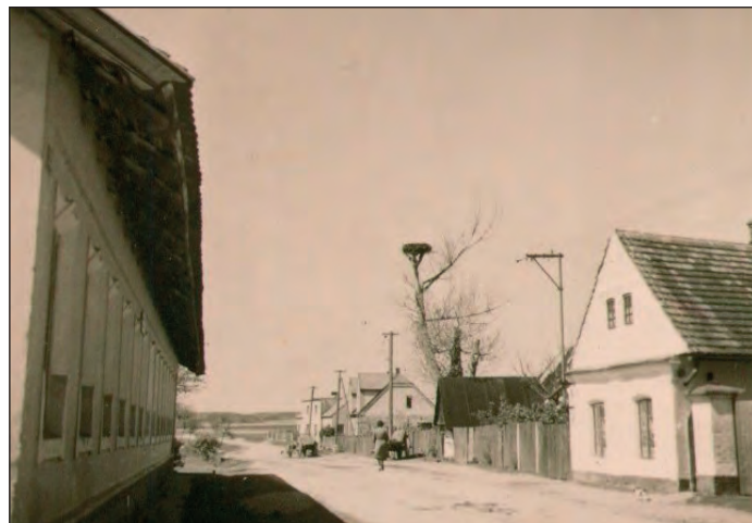
Pohled do dnešní Ambrožovy ulice na počátku 40. let 20. století.