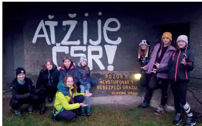
Skautky u bunkru, FOTO: Tereza Pavlíková

S přispěním oddílových vedoucích napsala Lucie Štursová