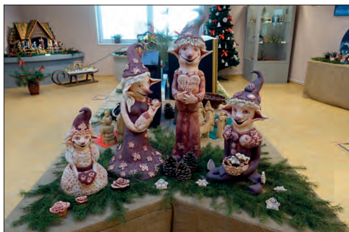
Keramické sochy skřítků od Soni Toucové