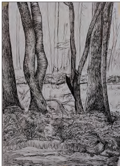
„Z plenéru 2022“

(kreslení a malování v přírodě), a to v termínech: 24. – 30. 6. 2023 a 1. – 7. 7. 2023 na Šerlišském mlýně. Tato pobytová akce je vhodná pro starší školáky (12+), dospělé, nebo rodiny se zájmem o kreslení a malování. Naučíme vás vidět přírodu trochu jinak, kreslit ji, pracovat s barvami a přenést svoje pocity a zážitky na papír. Vhodné i pro úplné začátečníky, skvělý relax.