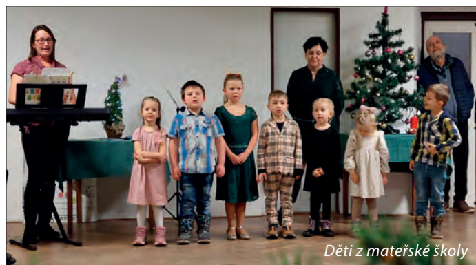
Děti z mateřské školy