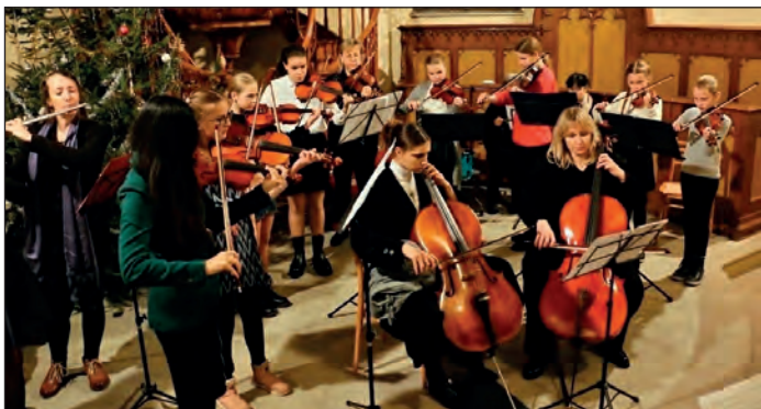
V programu adventního koncertu vystoupil i orchestr žáků smyčcového a dechového oddělení.