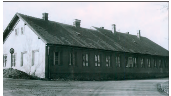
Čp. 291 v 70. letech 20. století

Ze zápisů v kronice města se dozvíme, že v roce 1748 byl špitálem nešťastných a též obydlím ponocného a jednoho hrobaře domek čp. 211 v ulici Pod Domy (později tu byla šatlava). V roce 1777 byl panský špitál uveden na místě, kde stávalo čp. 51 (na rohu ulic Na Kopečka a Čsl. legií), v roce 1812 je uveden jako Obrighritcher Spital – panský špitál. Ten byl prodán v roce 1832. Další dům, který město zakoupilo k podobnému účelu, byl domek čp. 165 v Pardubické ulici. Stalo se tak v roce 1883 a byl v něm zřízen městský špitál, později pojmenovaný městská nemocnice. O pět let později pak