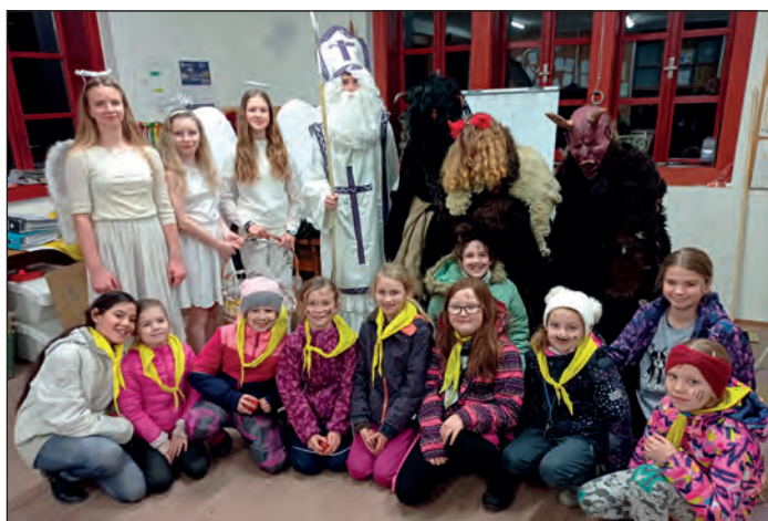
Mikulášská nadílka u světlušek, FOTO: Magda Pistorová