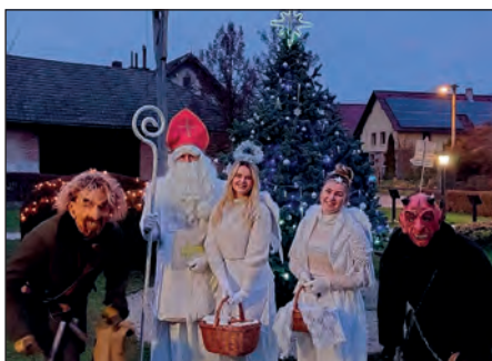
Mikulášská družina