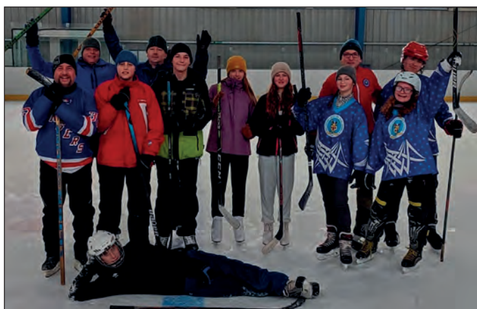
Skauti a skautky na ledě