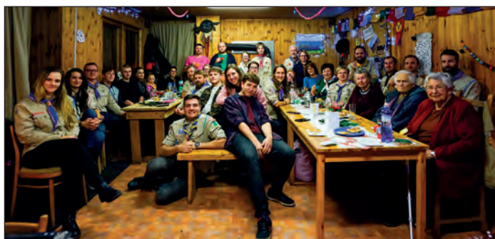
Vánoční besídka dospělých, FOTO: Pavel Čechura