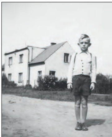
Vlevo čp. 857, vpravo čp. 858