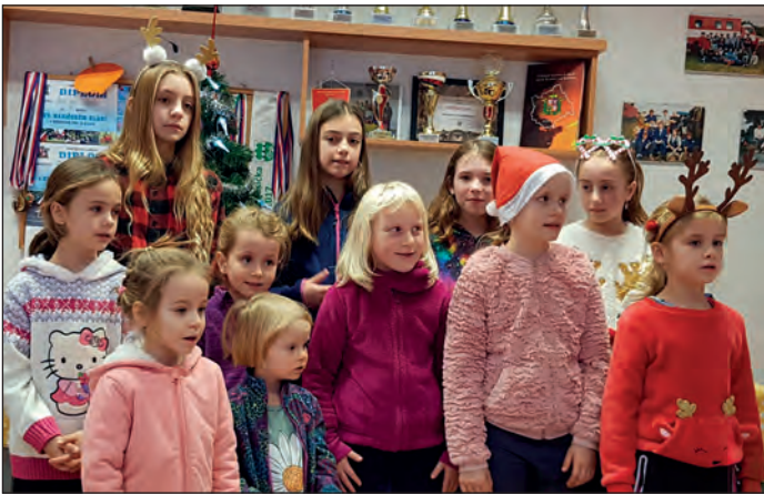
Vánoční besídka v hasičské klubovně.