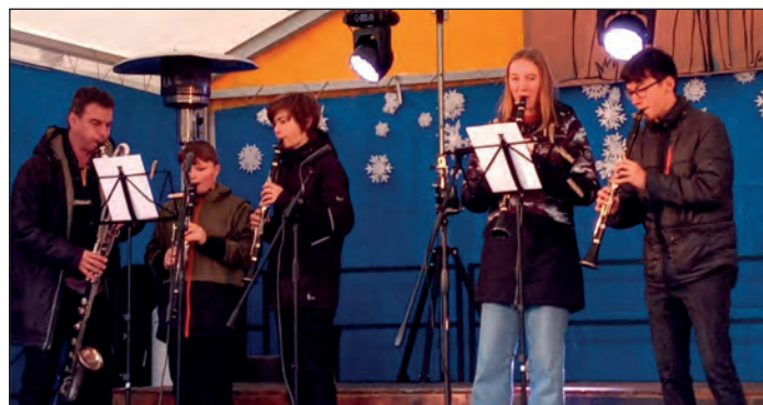
V programu na Betlémských trzích vystoupila naše komorní dechová seskupení.