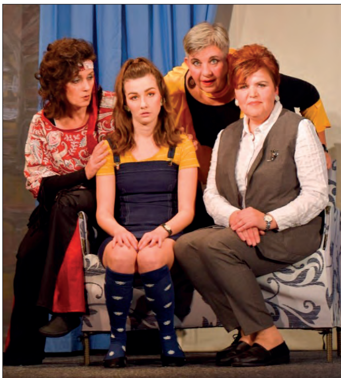
Jen pro zvané, FOTO: Petra Kuchařová